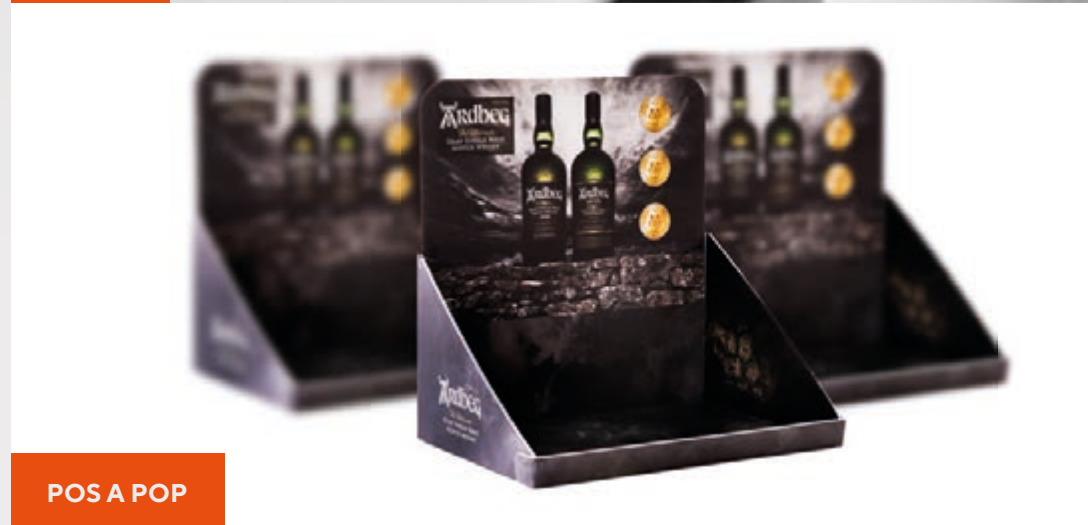
POS A POP